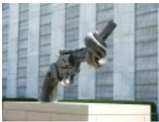
Centro Interdipartimentale di Ricerche sulla Pace "G. Nardulli"