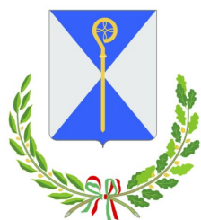
CITTÀ METROPOLITANA DI BARI