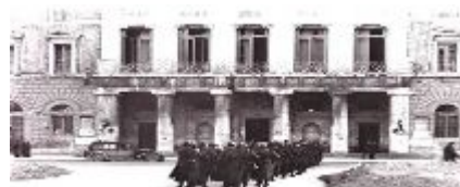
Istituto Pugliese per la Storia dell'Antifascismo e dell'Italia Contemporanea