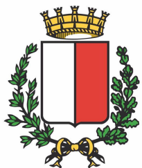
COMUNE DI BARI

L'evento, in collaborazione con RUniPace, Rete Università per la Pace è patrocinato dal Comune di Bari e dalla Città Metropolitana di Bari